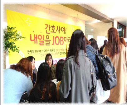
2016. 동강대학교(진로교육, 취업박람회)