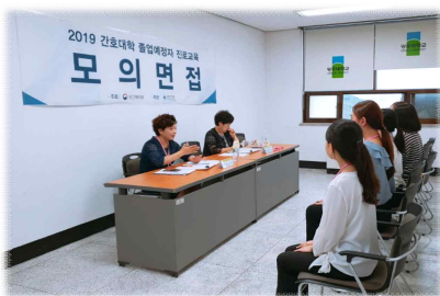
2019. 광주대학교(진로교육, 모의면접 등)