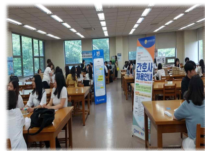
2018. 호남대학교(진로교육, 취업박람회)