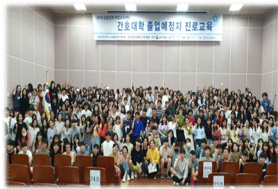
2019. 조선간호대학교(진로교육, 취업박람회)