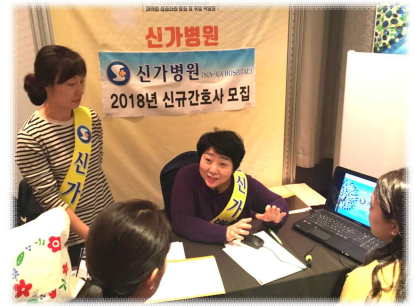
2017. হলি데이 인 광주(취업박람회)