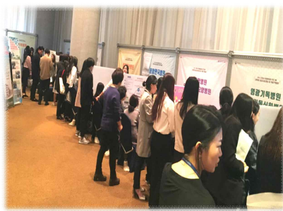
2017. হলি데이 인 광주(취업박람회)