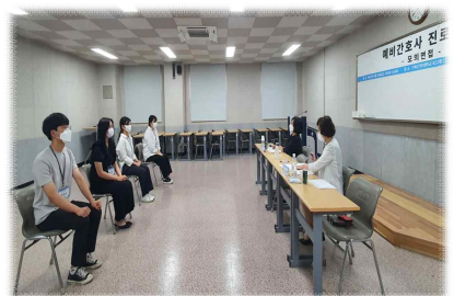
2022. 온라인 진로교육, 모의면접